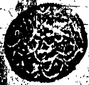
صورة عنوان نسخة دار الكتب المصرية برقم 1315